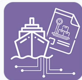
Manifiesto de Carga

“Las empresas de transportación marítima deberán proporcionar la información relativa a las mercancías que transporten consignadas en el manifiesto de carga, mediante la transmisión electrónica de datos...”