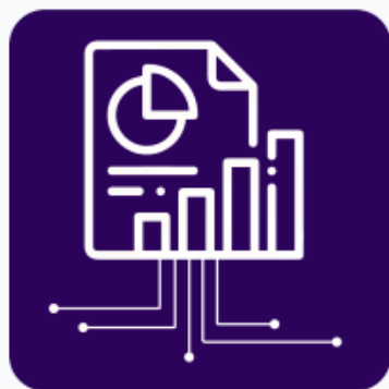
Reporte Movimiento Portuario de Contenedores (MP-M-02-A)