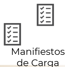
Manifiestos de Carga