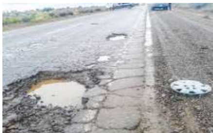
MENOR COSTO DE MANTENIMIENTO DE RUTAS