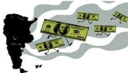
REDUCCIÓN EN LA SALIDA DE DIVISAS