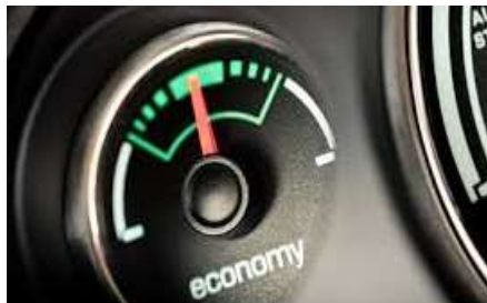
MAYOR EFICIENCIA ENERGÉTICA