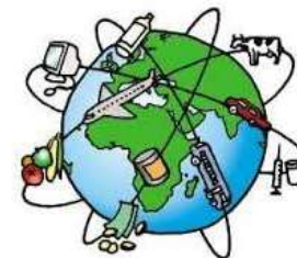
INTEGRACIÓN Y DIVERSIFICACIÓN ECONÓMICA