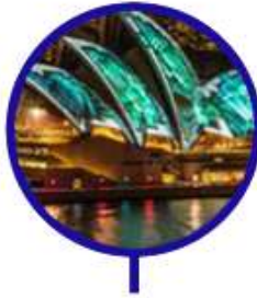
Luz como protagonista