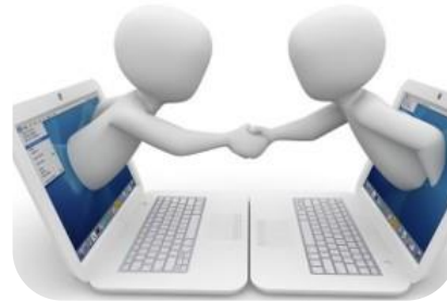
Proteja sus Sistemas de Control Industrial (ICS)