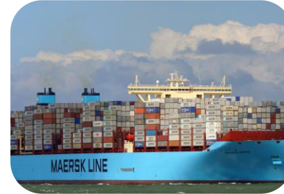
Proteja su renta

NotPetya causo perdida de $300M para Maersk